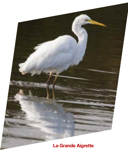
La Grande Aigrette

Dans le Nord et le Pas de Calais, la Grande Aigrette est une espèce nicheuse depuis peu. En Avesnois cette espèce est observée depuis une quinzaine d'années, notamment aux abords du lac du ValJoly durant la période hivernante (de mi-octobre à mi-mars). On note que les effectifs sont en constante évolution et les séjours de l'espèce de plus en plus longs, signe que les conditions d'accueil du territoire sont favorables à l'espèce.